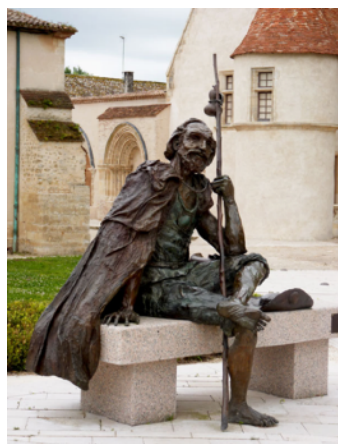
Point de ralliement de notre randonnée du 17 avril

Tous les troisièmes mercredis du mois : une randonnée est proposée à nos membres et amis pour débutants ou marcheurs confirmés. Une première randonnée a eu lieu le 17 avril au départ du Parc de Cayac à Gradignan. N'hésitez pas à venir ! Vous serez informés par courriel du prochain lieu de départ.